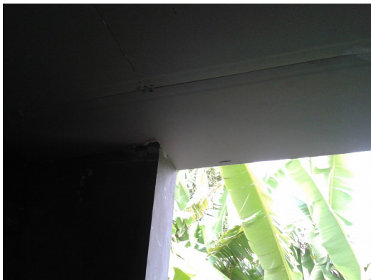
Figura 3: Forro de gesso no Isolamento invadindo o vão da janela e cobrindo sua verga.