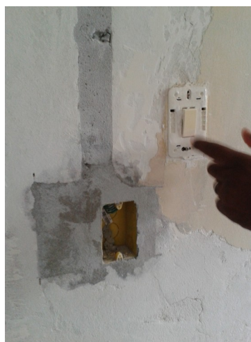
Figura 6: Retirar antigo interruptor na futura sala de Cirurgia e fazer os devidos reparos.