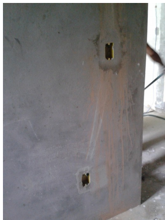
Figura 1: Pontos elétricos desalinhados na sala do Preparo. Alinhar a tomada baixa no mesmo eixo do ponto de telefone (mais alto).

Durante viagem de Lorena, será provável a visita de outra arquiteta do Atelier Plural para verificação destes serviços. Os demais serviços deverão se iniciar na semana de retorno de Lorena.