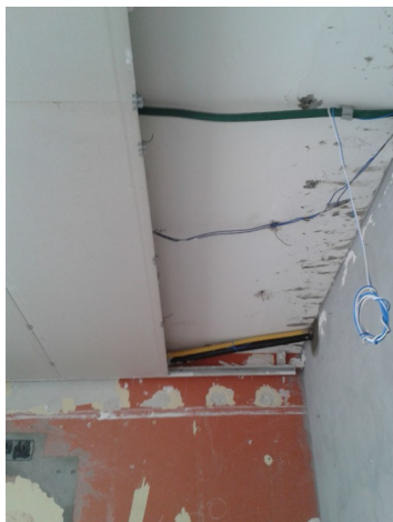
Figura 6: Instalação dos forros de gesso acartonado em andamento. Esta figura apresenta o forro do Estar dos Clientes, no trecho onde haverá colocação de um bite negativo/abertura para iluminação.