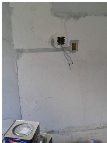
Figura 5: A caixa 4x4 é um antigo ponto elétrico que deverá ser retirado da Cirurgia, com posterior recomposição da parede. Verificar e reparar danos prováveis na face externa dessa parede.