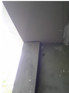
Figura 4: Outro ângulo do que mostra a figura 3.