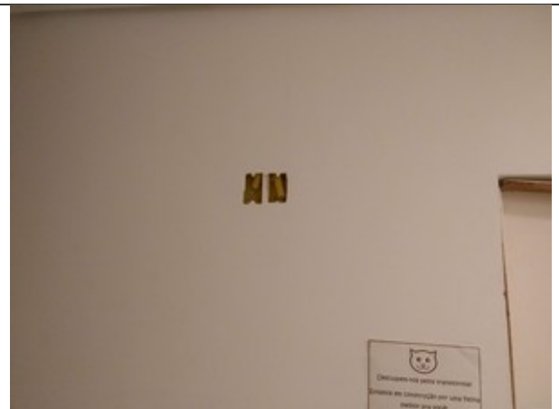
FIGURA 2 – Pontos de antena e tomada da TV do Estar que não foram instalados pela equipe de obra anterior.