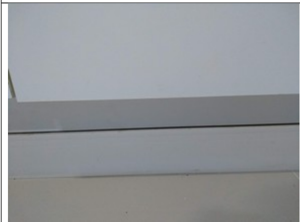
FIGURA 3 – Encontro do acabamento de madeira e o rodapé da Internação sem rejunte.