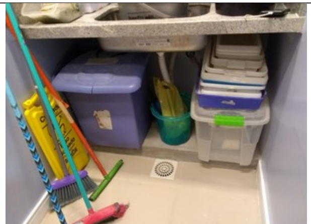
FIGURA 4 – Instalar rodapé na base do futuro armário da Recuperação.