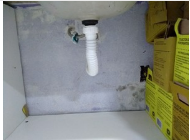
FIGURA 6 – Checar umidade dessa parede, corrigir e repintar.