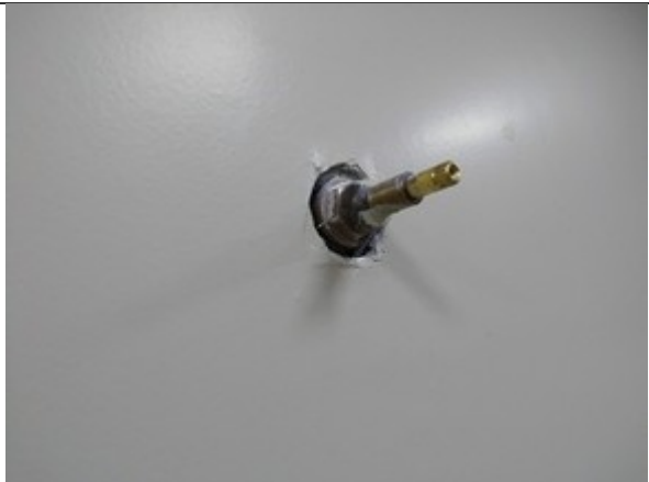
FIGURA 5 – Checar modelos dos registros para compra dos acabamentos.