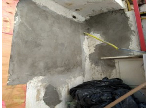
FIGURA 4 – O canto onde está saindo o eletroduto ficou com muito cimento, criando um pequeno “calombo” nesse ponto. Talvez seja necessário embutir mais o elemento (checar no local) que causou a necessidade deste preenchimento.