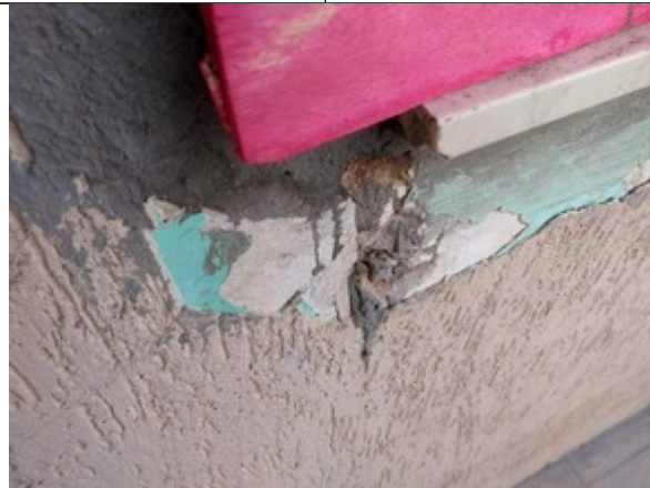
FIGURA 5 – É preciso retirar da parede o ferro da grade antiga. Ou pelo menos cortá-lo rente e cimentar o trecho aparente.